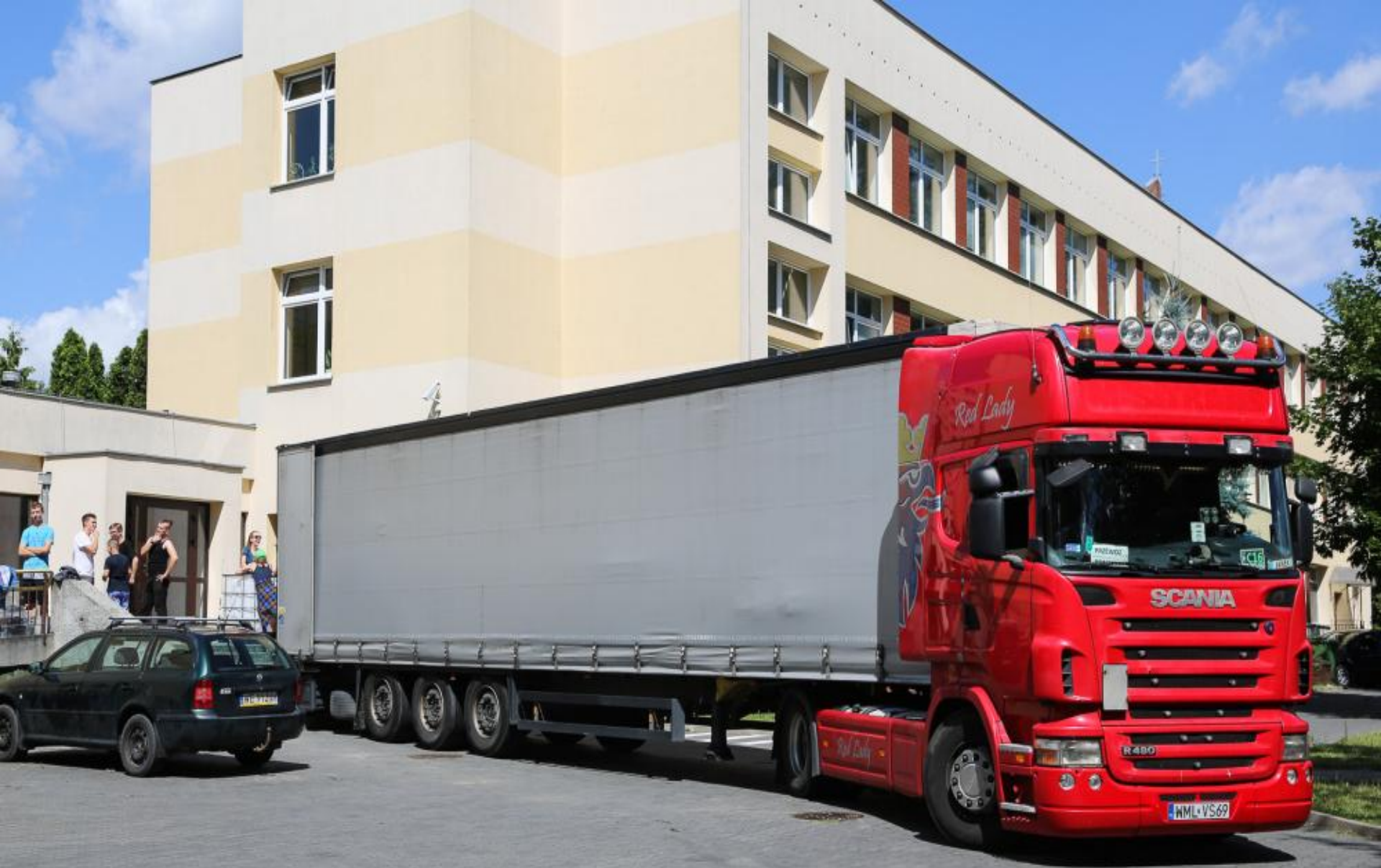
pakowanie TIRa - przed wyjazdem na kwaterkę